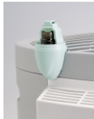
Praktische Kabelaufwicklung. Practical cable coil-up device.